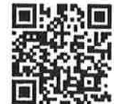
สแกนเข้ากลุ่มอบรมฯ