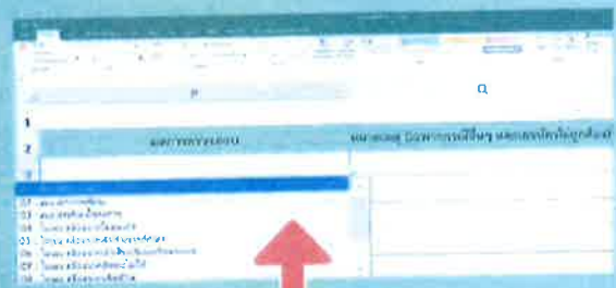
2. เลือก ผลการตรวจสอบจากตัวเลือก