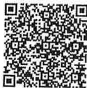
ตัวอย่างเอกสารการคัดเลือก อถล.