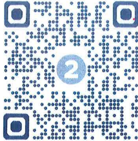
Qr Code แบบตอบรับภาคเหนือ