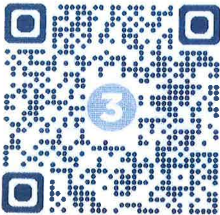
Qr Code แบบตอบรับภาคกลาง