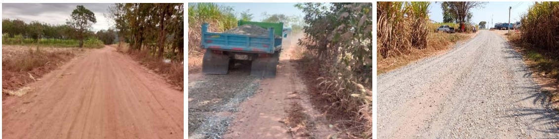
ปรับปรุงถนนหินคลุก หมู่ที่ ๑๒ บ้านเทพนิมิต สายชันน้ำหวาน งบประมาณ ๑๙๔,๐๐๐.๐๐ บาท