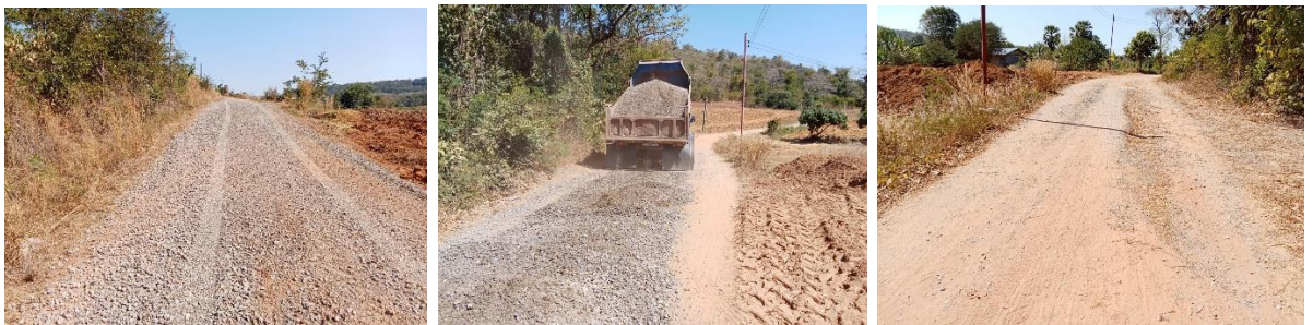
ปรับปรุงถนนหินคลุก หมู่ที่ ๑๖ บ้านแก้งสัมพันธ์ ซอยพญาไทร งบประมาณ ๙๗,๐๐๐.๐๐ บาท