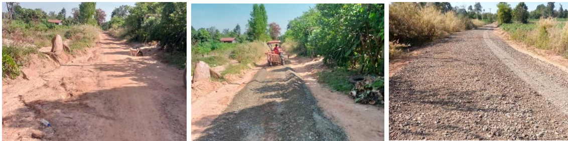
ปรับปรุงถนนหินคลุก หมู่ที่ ๑๓ บ้านโนนจำปา สายบ้านโนนจำปา-บ้านโคกอนุ งบประมาณ ๑๙๔,๐๐๐.๐๐ บาท