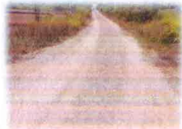
โครงการซ่อมแซมถนนหินคลุก สายหลังโรงเรียนบ้านนาประชาสัมพันธ์ สาขาโคกอนุ บ้านโคกอนุ หมู่ที่ 9