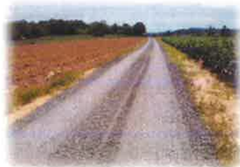
โครงการซ่อมแซมถนนหินคลุก สายสามแยกวังครก บ้านโคกสะอาด หมู่ที่ 6