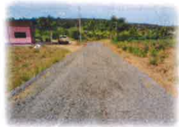
โครงการซ่อมแซมถนนหินคลุก ซอยหลังวัดชัยมงคลโนนจำปา บ้านโนนจำปา หมู่ที่ 13