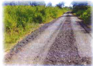
โครงการซ่อมแซมถนนหินคลุก สายเขาเหลียง บ้านประตู่ซบกัด หมู่ที่ 15