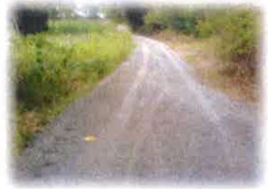
โครงการซ่อมแซมถนนหินคลุก ขอยต้นตาล บ้านคลองไทร หมู่ที่ 7