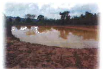
โครงการขุดลอกสระน้ำสาธารณะประโยชน์ คุ่มซัดกาด หมู่ที่ 15 บ้านประตูซัดกาด