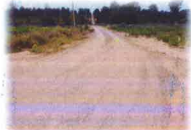
โครงการซ่อมแซมถนนหินคลุก สายหลักบ้านเทพนิมิต - บ้านห้วยหินฝน หมู่ที่ 12