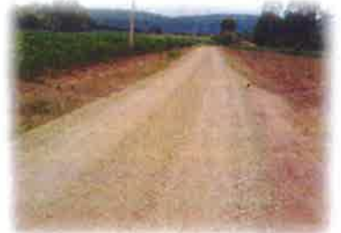
โครงการซ่อมแซมถนนหินคลุก สายคุ้มที่ 7 คุ้มเขาใหญ่ บ้านห้วยน้อย หมู่ที่ 8