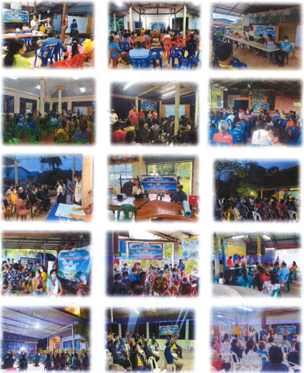
โครงการประชาคมแผนพัฒนาท้องถิ่น พ.ศ. 2566-2570