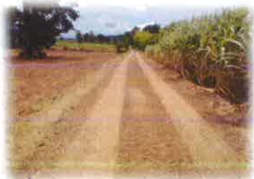
โครงการซ่อมแซมถนนหินคลุก สายโชคสัมพันธ์-หินตาดสะเตา บ้านเก้าสัมพันธ์ หมู่ที่ 16