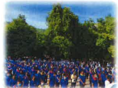
โครงการป้องกันและแก้ไขปัญหายาเสพติด (กิจกรรมเดินรณรงค์ต่อต้านยาเสพติด)