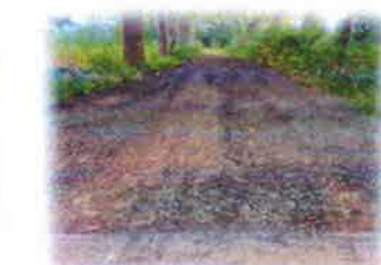
โครงการซ่อมแซมถนนโดยลงหินคลุก ซอยทางเข้าไร่ผู้ช่วยสะอาด ชูชาติ บ้านหัวสะพาน หมู่ที่ 2