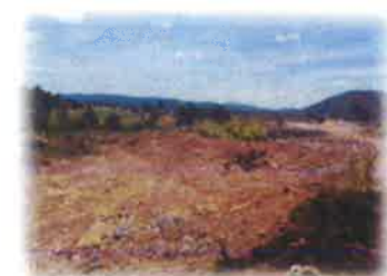
โครงการพัฒนาศักยภาพคณะกรรมการบริหารจัดการขยะมูลฝอยตำบลนายงกลัก