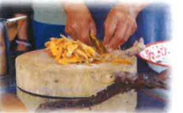
โครงการส่งเสริมกิจกรรมฝึกอาชีพเพิ่มรายได้ "ยาหม่องสมุนไพรและน้ำมันเหลือง"