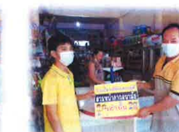
ประชาสัมพันธ์มาตรการการป้องกันและควบคุมโรคโควิด-19 โดยเน้นการสวมหน้ากากอนามัยก่อนใช้บริการร้านค้า/ร้านอาหาร