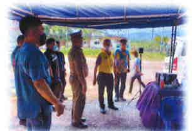
โครงการป้องกันและลดอุบัติเหตุช่วงเทศกาลสงกรานต์