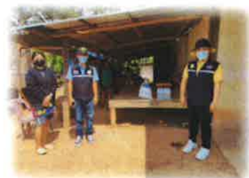
โครงการช่วยเหลือประชาชนตามอำนาจหน้าที่ขององค์กรปกครองส่วนท้องถิ่นด้านส่งเสริมพัฒนาคุณภาพชีวิต