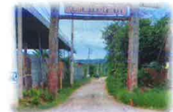
โครงการซ่อมแซมถนนโดยลงหินคลุก ซอยวัดศรีดาวเรืองวนาราม บ้านหัวสะพาน หมู่ที่ 2