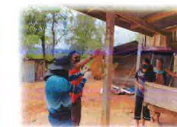
โครงการสัตว์ปลอดโรค คนปลอดภัย จากโรคพิษสุนัขบ้า