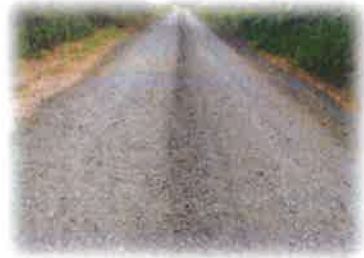
โครงการซ่อมแซมถนนหินคลุก สายบ้านวังช้าง - พระพุทธบาท บ้านวังช้าง หมู่ที่ 11