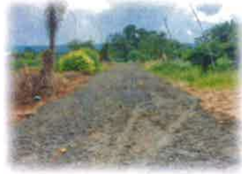
โครงการซ่อมแซมถนนหินคลุก ซอยข้างบ้านหมอเจนภพ ศุภวัตรวิบูลย์ บ้านหัวสะพาน หมู่ที่ 2