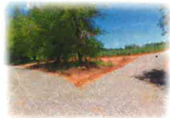
โครงการซ่อมแซมถนนหินคลุก สายเข้าอ่างเก็บน้ำเขากรด บ้านนายงกลัก ช่วงที่ 2 หมู่ที่ 1