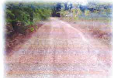
โครงการซ่อมแซมถนนหินคลุก สายโชคสัมพันธ์-เขาคอก บ้านเก้าสัมพันธ์ หมู่ที่ 16