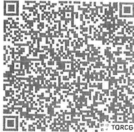
QR code ตรวจสอบรายชื่อผู้เข้าอบรม

* กรอกใบสมัครผ่าน Google Form ตั้งแต่บัดนี้เป็นต้นไป จนถึงก่อนการฝึกอบรม ๗ วัน และให้ประสานเจ้าหน้าที่โดยตรง