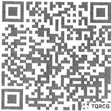
QR code สมัครเข้าอบรม