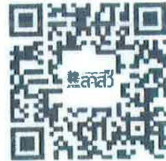
คำอธิบายและขั้นตอนการออกบัตรประจำตัว พนักงานเจ้าหน้าที่ฯ