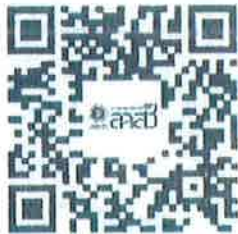
แบบฟอร์มที่เกี่ยวข้อง