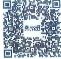
คู่มือการใช้ระบบบัตรประจำตัวพนักงานเจ้าหน้าที่ฯ