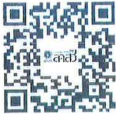
ระเบียบและประกาศที่เกี่ยวข้อง