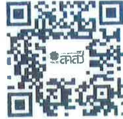
หลักสุตรความรู้พระราชบัญญัติสุขภาพจิตฯ