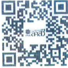
ระบบบัตรประจำตัวพนักงานเจ้าหน้าที่ฯ